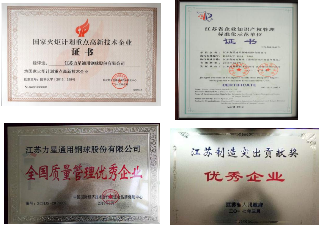
图 3 公司荣获部分荣誉资质