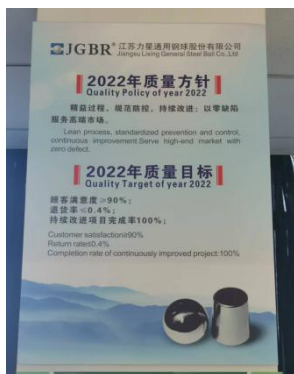
图 8 公司质量方针

在质量方针的指导下，建立了公司部门负责人绩效和员工绩效两层绩效管理。每年根据经营战略管理目标和部门的职能，将公司战略逐步向下分解，并形成员工层级的绩效目标，从而保持员工个人目标与公司整体目标的一致性。在体系运行过程中，公司运用各种科学、有效的方法，测量、分析、整理各单位及所有层次、过程的绩效数据和信息。公司采用了基于 PDCA 循环的系统、全面的改进方法来管理改进过程。公司倡导并采用了多种工具来改进公司各部门、各层次的绩效，并根据测评结果采用学习和创新方式，不断修正战略目标和计划，坚持改进和调整，确保公司长、短期战略目标地实现。