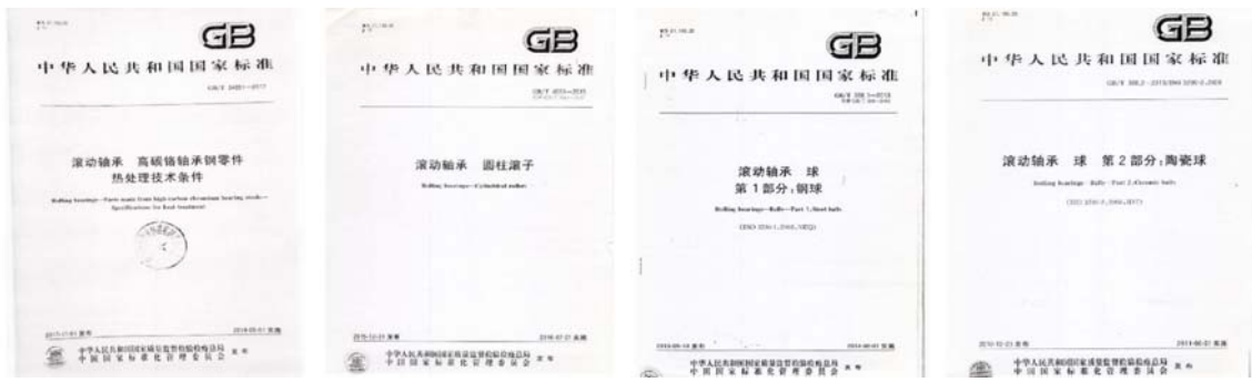
图 11 公司部分企业标准

与此同时，公司积极主导或参与国家标准、行业标准和地方标准的制修订工作，其中公司参与修订国家标准“GB/T 34891-2017 滚动轴承 高碳铬轴承钢零件”、“GB/T 4661-2015 滚动轴承圆柱滚子”、“GB/T 308.1-2013 滚动轴承球 第 1 部分：钢球”、“GB/T 308.2-2010 滚动轴承球 第 2 部分：陶瓷球”等。